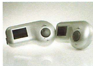
Art.-no. idromed® 5 GS: 100 000 Art.-no. idromed® 5 PS: 110 000