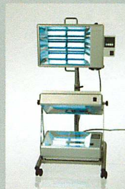
dermalight® 500-3 stativ med 3 enheder