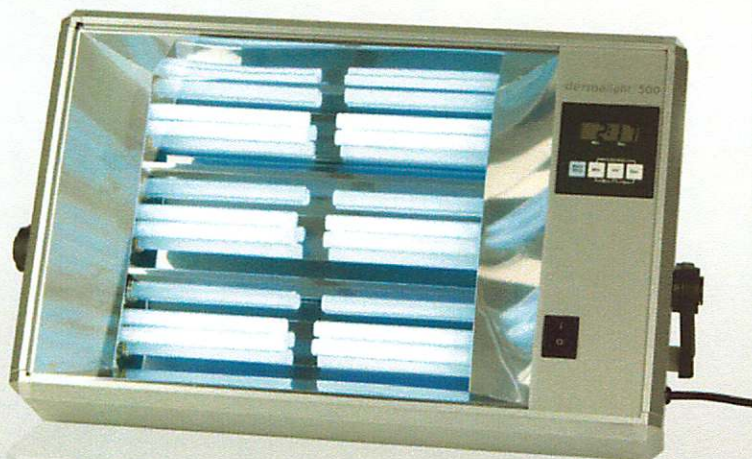
dermalight® 500 basic unit