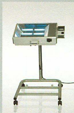
dermalight® 500-1 stativ med 1 enhed